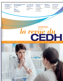
La Revue du CEDH